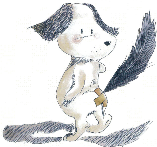
illustration & essay color Translated by